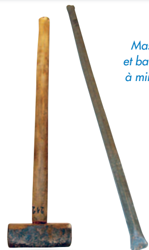
Masse et barre à mine.

Visitez le Musée de Fully et ses vitrines didactiques!