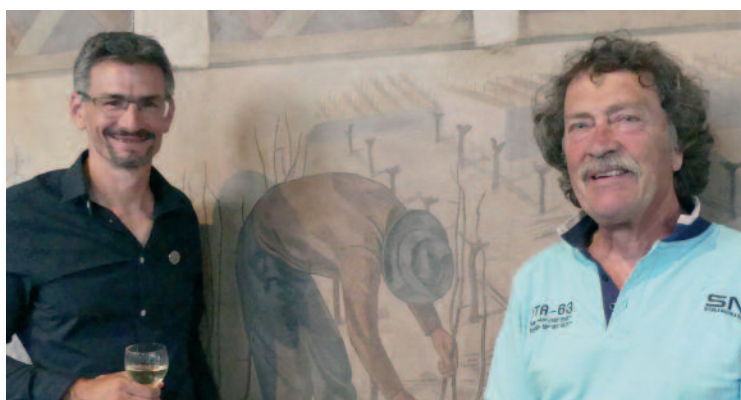
Deux anciens présidents. ▲