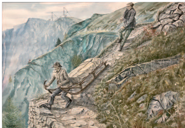
Un chemin à traîneau par le Larzay.

Équipés de pics, de masses et d'outils sommaires, tous encore visibles au Musée de Fully, ils taillèrent, durant l'été 1883 dans la forêt pentue, le pierrier instable et le roc ingrat, un sentier à luge où les murs en pierres sèches exposent encore le savoir-faire de nos ancêtres. Combien étaient-ils pour construire ce passage? Nul ne le sait. Ils devaient en être fiers puisqu'ils gravèrent sur le rocher, avant la montée difficile des petits contours,