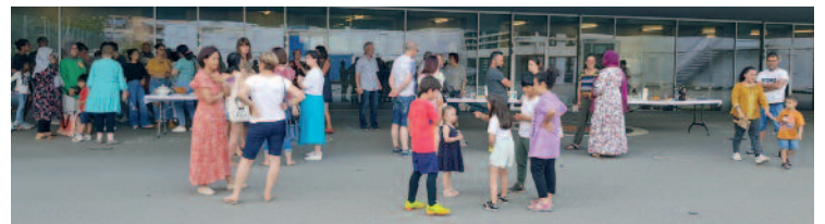
Ambiance chaleureuse dans la cour de Charnot.

Vous trouverez le programme et le document d'inscription à la réception communale ou sur le site de la commune: fully.ch/fr/Social-sante/Integration/