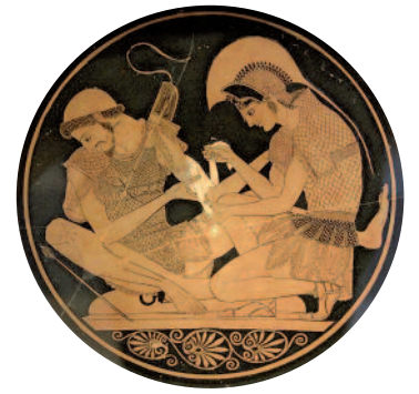
Achille soignant Patrocle.

De nos jours, l'achillée millefeuille est principalement employée pour ses vertus digestives et convient très bien aux femmes souffrant de règles trop abondantes ou irrégulières. L'achillée millefeuille aurait un effet semblable à la progestérone. Elle est également utile en cas de troubles circulatoires tels que les varices ou les hémorroïdes,